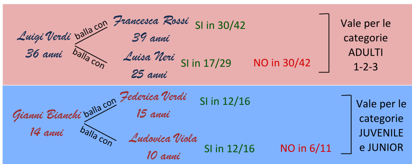
Figura 2 Regola per la scelta delle categorie