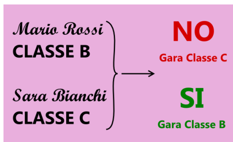
Figura 1 Regola per la scelta delle classi

2) Si dà la possibilità a Dame e Cavalieri di competere in diverse categorie (ma della stessa classe) con partner diversi. Anche in questi casi si applica la regola dello svantaggio, vediamo qui sotto vari esempi idonei e non idonei: