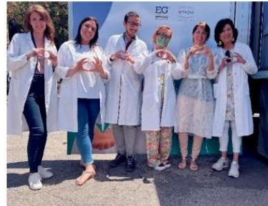
Lo staff di specialisti medici che offriranno i consulti gratuiti

toporsi a controlli gratuiti e consulti di tipo cardiologico, dermatologico, nutrizionale e reumatologico, con specialisti di società scientifiche del settore. Nelle precedenti edizioni, grazie allo screening diverse persone ignare hanno scoperto di avere problemi di salute e hanno così evitato conseguenze potenzialmente gravi. Ci sarà poi lo sportello d'ascolto con specialisti della Federazio-