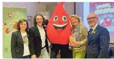
La presentazione del fumetto "Corri Gocciolina!"