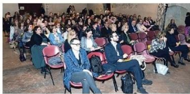
Parte del pubblico al convegno sulla salute di genere.