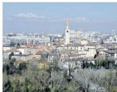
LA CITTÀ Pordenone al sesto posto per livello di reddito

I DETTAGLI Se la lente d'ingrandimento seleziona le classi di reddito, i dati dicono che una quota significativa dei contribuenti, pari al 36%, dichiara meno di 15mila euro; un altro terzo dichiara tra i 15mila e i 26mila euro. Un 4,9%, pari a 45.737 contribuenti, dichiara più di 55mila euro. Vi sono poi quelli che vanno oltre i 120mila euro, in tutto 7.482 contribuenti, cioè lo 0,8% del totale. Nel 2022 il numero di contribuenti è aumentato dello 0,8% (cioè 7.311 unità), come nel resto dell'Italia, riprendendo una curva ascendente dopo il calo concomitante con la pandemia. L'analisi dell'Ires Fvg mette inoltre in evidenza che con il passare degli anni si stanno accorciando le distanze tra il reddito da pensione e quello da lavoro dipendente, tanto che ormai la differenza è ridotta al 10 per cento circa. Punti decisamente distanti rispetto ai 30 punti di scarto dell'inizio degli anni Duemila. Una tendenza che, rileva lo studio, è in linea